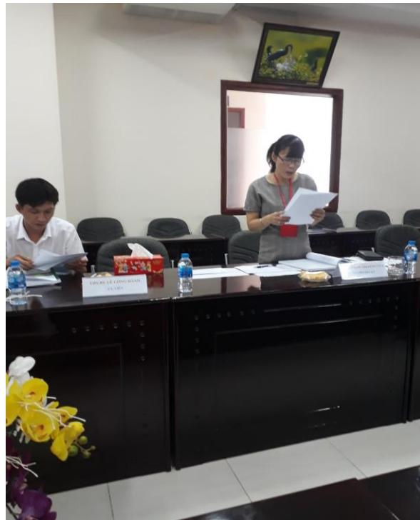
Phòng Đào tạo Đại học