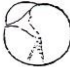
Màng nhĩ trái