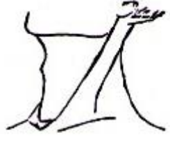
Cổ nghiêng trái