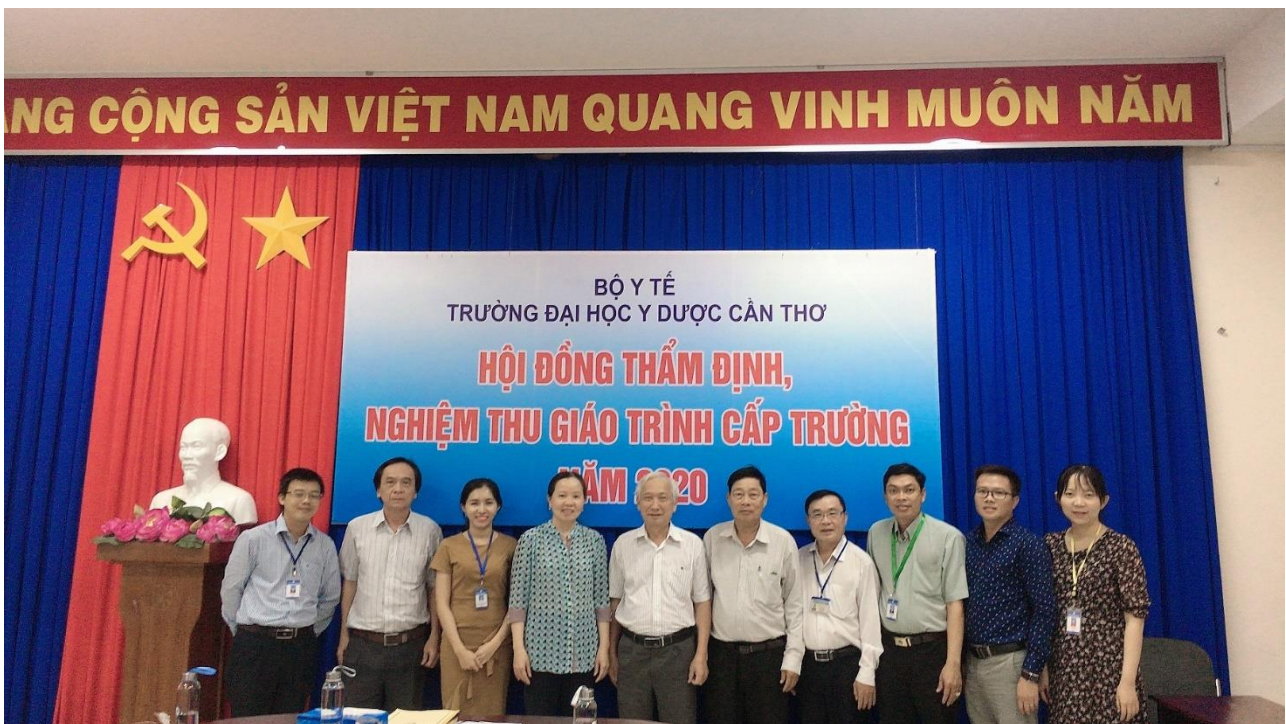
Hội đồng thẩm định, nghiệm thu giáo trình chụp hình lưu niệm cùng Ban biên soạn