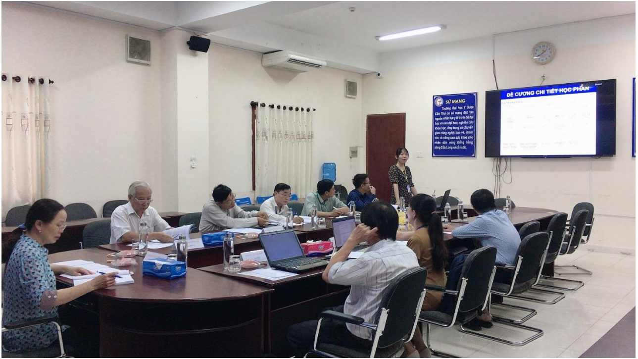
Toàn cảnh buổi làm việc