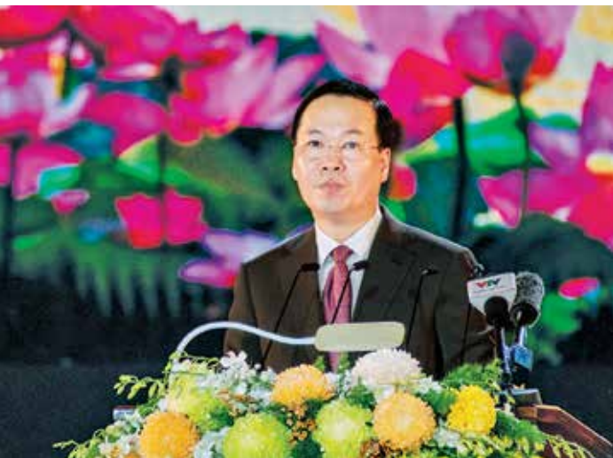
Chủ tịch nước Võ Văn Thưởng phát biểu tại lễ kỷ niệm 20 năm thành lập thành phố Cần Thơ trực thuộc Trung ương.

Qua 20 năm xây dựng và phát triển, quy mô nền kinh tế được mở rộng, đóng góp vào sự phát triển chung của vùng ĐBSCL và cả nước; đến năm 2023, giá trị tổng sản phẩm trên địa bàn đạt hơn 118.000 tỷ đồng, gấp 10,2 lần so năm 2004. Tổng sản phẩm bình quân đầu người (GRDP/người) năm 2023 đạt 94,7 triệu đồng, gấp 9,2 lần so năm 2004, góp phần nâng cao chất lượng cuộc sống người dân thành phố.