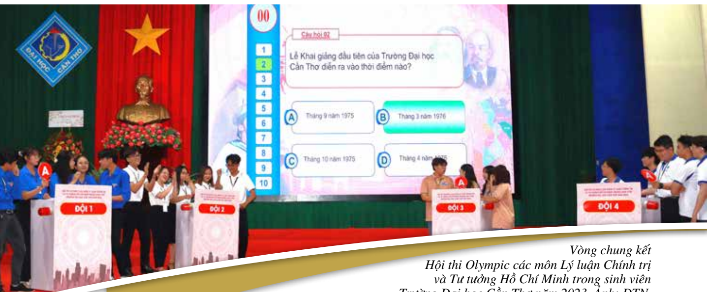
Vòng chung kết Hội thi Olympic các môn Lý luận Chính trị và Tư tưởng Hồ Chí Minh trong sinh viên Trường Đại học Cần Thơ năm 2023.