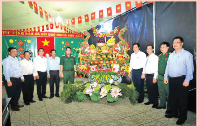
Các đồng chí lãnh đạo thành phố và huyện Phong Điền tham quan mô hình trang trí trái cây tại Khai mạc Tết Quân - Dân năm 2024, với chủ đề "Quân - Dân Cần Thơ vui Tết chào mừng 20 năm TP. Cần Thơ trực thuộc Trung ương".