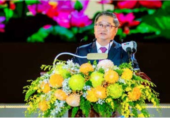
Đồng chí Trần Việt Trường, Phó Bí thư Thành ủy, Chủ tịch UBND thành phố Cần Thơ phát biểu tiếp thu ý kiến của Chủ tịch nước Võ Văn Thưởng.