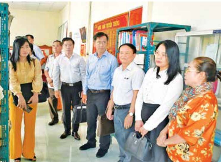
Đoàn công tác khảo sát tình hình sử dụng sách thuộc Đề án trang bị sách cho cơ sở xã, phường, thị trấn tại xã Trường Long, huyện Phong Điền. Ảnh: Phong Dinh.

Ngoài ra, đối với các ấn phẩm (sách giấy và điện tử) thuộc Đề án trang bị sách cho cơ sở xã, phường, thị trấn do Nhà xuất bản Chính trị quốc gia Sự thật và Ban Tuyên giáo Trung ương phối hợp triển khai, thực hiện có nhiều thể loại, nội dung phong phú, thiết thực, hình thức trình bày đẹp, chất lượng biên tập, biên soạn ngắn gọn, súc tích, cập nhật nhiều thông tin, đảm bảo đầy đủ tính chính trị, tính khoa học, tính thực tiễn, tính chiến đấu và tính thuyết phục, phục vụ kịp thời cho việc nghiên