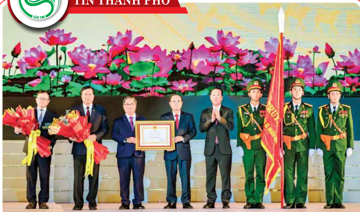
Chủ tịch nước Võ Văn Thưởng trao tặng Huân chương Lao động hạng Nhất cho Đảng bộ, chính quyền và Nhân dân TP Cần Thơ.