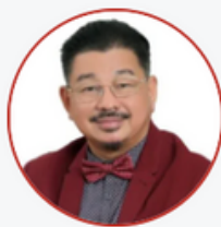
PGS TS BS LÊ HÀNH

ĐẠI HỘI NHIỆM KỲ II (2023 – 2028) HỘI NGHỊ KHOA HỌC QUỐC TẾ THƯỜNG NIÊN VSAPS LẦN THỨ 8